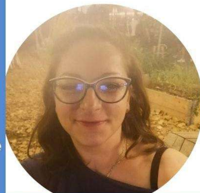
MARIAPINA BALESTRA SCUOLA SECONDARIA DI PRIMO GRADO

È necessario che la scuola riprenda la sua centralità nella società contemporanea e che riacquisti il suo valore. Noi ci impegniamo perché ciò avvenga.