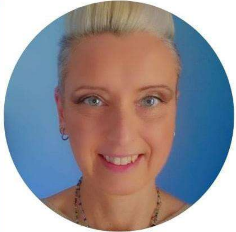
MARTA ERODIANI SCUOLA PRIMARIA

Sono fermamente convinta che la scuola sia un luogo di crescita fondamentale per gli studenti e che il benessere di tutti i componenti della comunità scolastica sia un prerequisito per il successo formativo. Per questo, se eletta al CSPI, mi impegnerò con tenacia e passione a rappresentare gli interessi di tutti, lavorando per un sistema scolastico sempre più inclusivo, equo ed efficiente."