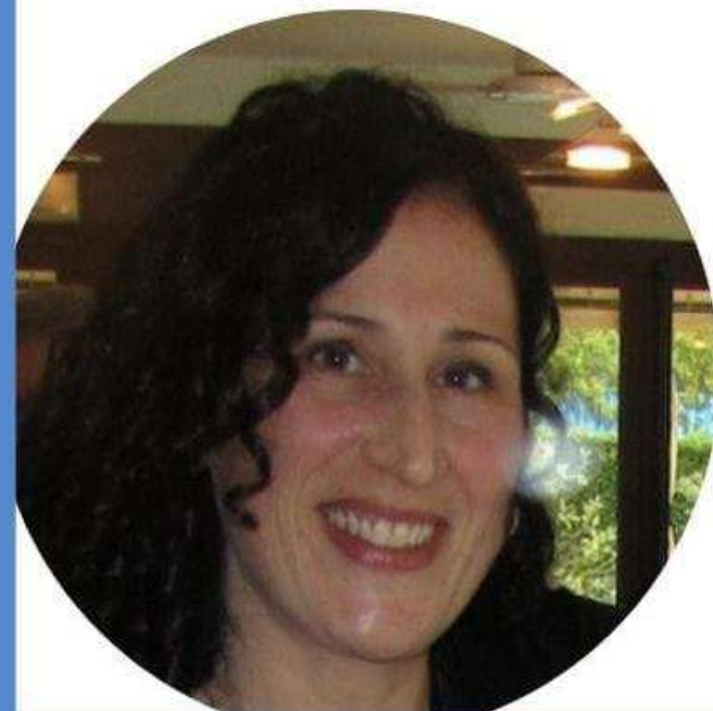
GIOVANNA TESTA SCUOLA PRIMARIA

Credo che il CSPI possa essere uno strumento per dare voce ai docenti e per costruire una scuola migliore per tutti. Se anche tu credi in questi valori vota per me, vota la lista "NOI SCUOLA BENE COMUNE"!